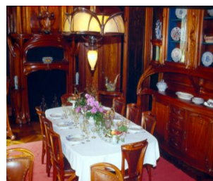
Musée de l'école de Nancy

Enfin, Nancy possède une promenade, dessinée au XVIIe (le cours Léopold) et un jardin botanique, aménagé en 1752 par le roi Stanislas.